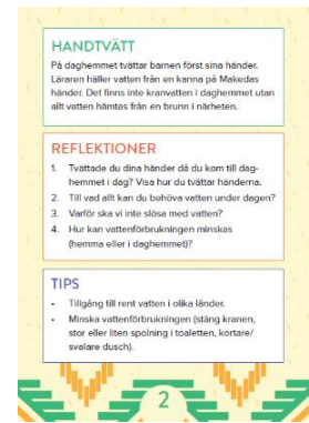
Uppgiftskortets baksida: beskrivning, reflektioner och tips