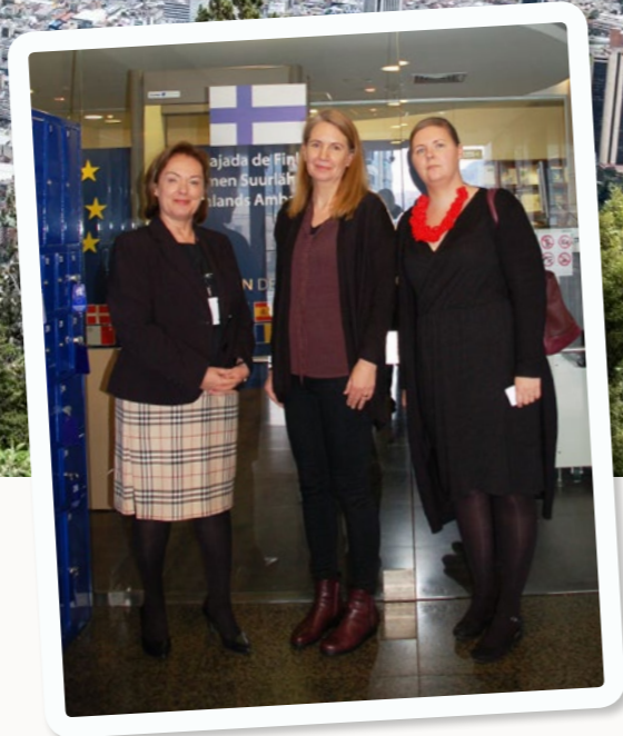
Adoptivfamiljerna sköter under sin adoptionsresa pass- eller visumärenden hos Finlands ambassad. Adoptionstjänstens personal träffar ambassadernas personal under sina arbetsresor.

Adoptionstjänstens arbetsresor till kontaktländerna och besöken från kontaktländerna till Finland är viktiga för att stärka det ömsesidiga förtroendet och främja samarbetet. Under verksamhetsåret gjorde vi arbetsresor till Taiwan, Thailand och Colombia. Dessutom deltog vår verksamhetsledare i mötet som EurAdopts råd höll i Luxemburg i månadsskiftet mars/april.